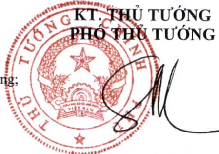
Phạm Bình Minh